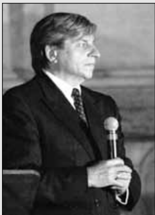
Benjamin R. Barber , politológus:

Kölcsönös Függőség Politikájának szolgálatában: emberek, népek és államok az egységesebb világért”. Bárán vállalták ebben: Először, hogy kötelesek elutasítani mindenféle erőszakot, és, hogy mindenkinek joga van a globális biztonsághoz. Másodszor, hogy kötelezik magukat az idegenek befogadására és a bevándorlók jogainak biztosítására. Harmadszor, kötelesek biztosítani az élelmet