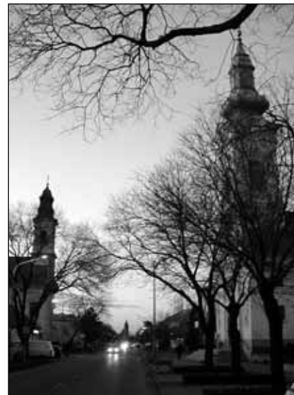
Szentől szemben, de ugyanazon az úton – a református és a katolikus templom Monoron.

Közben néhány testvérrel kezd kibontakozni egy szép, új, bensőséges dialógus. 2002 tavaszán a plébánia egyik munkatársa részt vesz