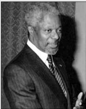
Kofi Annan , az ENSZ főtitkára:

gyunk; ha gyermekek kerülnek veszélybe, minden gyermek veszélyeztetett. Csak együtt maradhatunk életben, együtt lehetünk szabadok. Egyedül senki sem lehet túlélő vagy szabad, bármilyen hatalommal rendelkezzen is.”