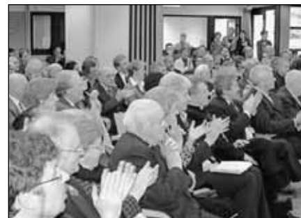
Nirwe Stad (6)

A Máriapoliban megélt igazi testvériségből egy mindenkire nyitott közösség született. Az első időkben minden hónapban megrendezték a „Nyitott ajtók” napját, hogy megosszák az egység tapasztalatát másokkal is. A városka a találkozások színterévé vált: muzulmánok, zsidók, de sérült emberek, börtönviseltek is, mind otthonra találtak, sőt erőt meríthettek a személyes megújuláshoz is. A művészek is polgárjogot nyertek. „Részeseadjunk együtt a természet szépségéből” – ez a téma több mint negyven tehetséget gyűjtött össze a környékből. A mintegy négyszázötven látogatót nemcsak a béke és a szépség légköre érintette meg, hanem a mindenkire kiterjedő kölcsönös szeretet is. A községi környezetvédelmi tanácsos így nyilatkozott – „Elloptátok az ötletemet, jobban mondván, megvalósítottátok régi álmomat.”