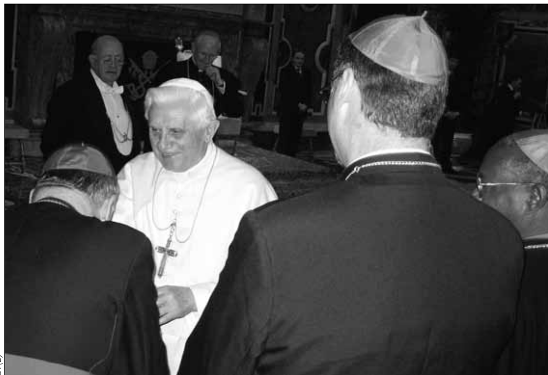
XVI. Benedek pápa üdvözlö a kongresszus résztvevőit