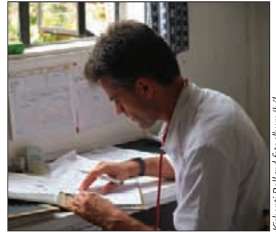
Kishonti Rolland fotóalbumából

Eközben azt is láthatam, hogy a fokolaré lel-