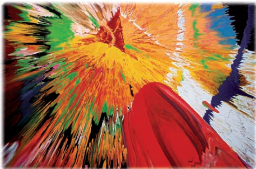
Illusztráció: Damien Hirst / CN

S mindez azért volt így, mert Isten szabadnak teremtette őket. Jézus a mennyből szállt alá a földre és képes lett volna mindenkit egyetlen pillantásával feltámasztani. De mivel Isten az embereket saját képmására teremtette, meg