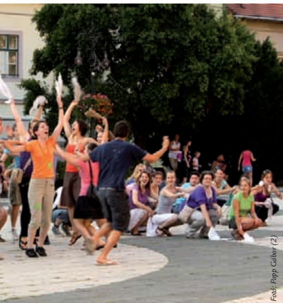
Fotó: Papp Gábor (2)