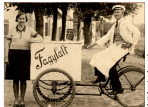
Perjés Bernadett illusztrációja

Különleges kiállítást látogathatnak meg az érdeklődők Szekszárd városában. A Wosinsky Mór Megyei Múzeum igen sajátos kiállítási anyaga ötezer éves időutazásra invitálja látogatóit, ahol a fagylalt őse és első fogyasztói mellett a jégkrém és a parfé történetével is megismerkedhetnek az érdeklődők. Végigkísérhetjük a fagylalt diadalútját, bepillantathatunk készítési módjának fejlődésébe, a magyar fagylaltozás hőskorának eseményeibe. Megtudhatjuk, miként vált mindennapi életünk részévé. A kiállítás 2012. augusztus 31-ig látogatható. Szó szerint kellemesen hűsítő program.