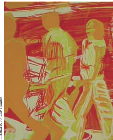
Illusztráció: Antonio Salmasso

Jézus azért figyelmeztet a jutalomra vagy büntetésre, amely földi életünk után vár ránk, mert szeret minket. Ő tudja, amit az