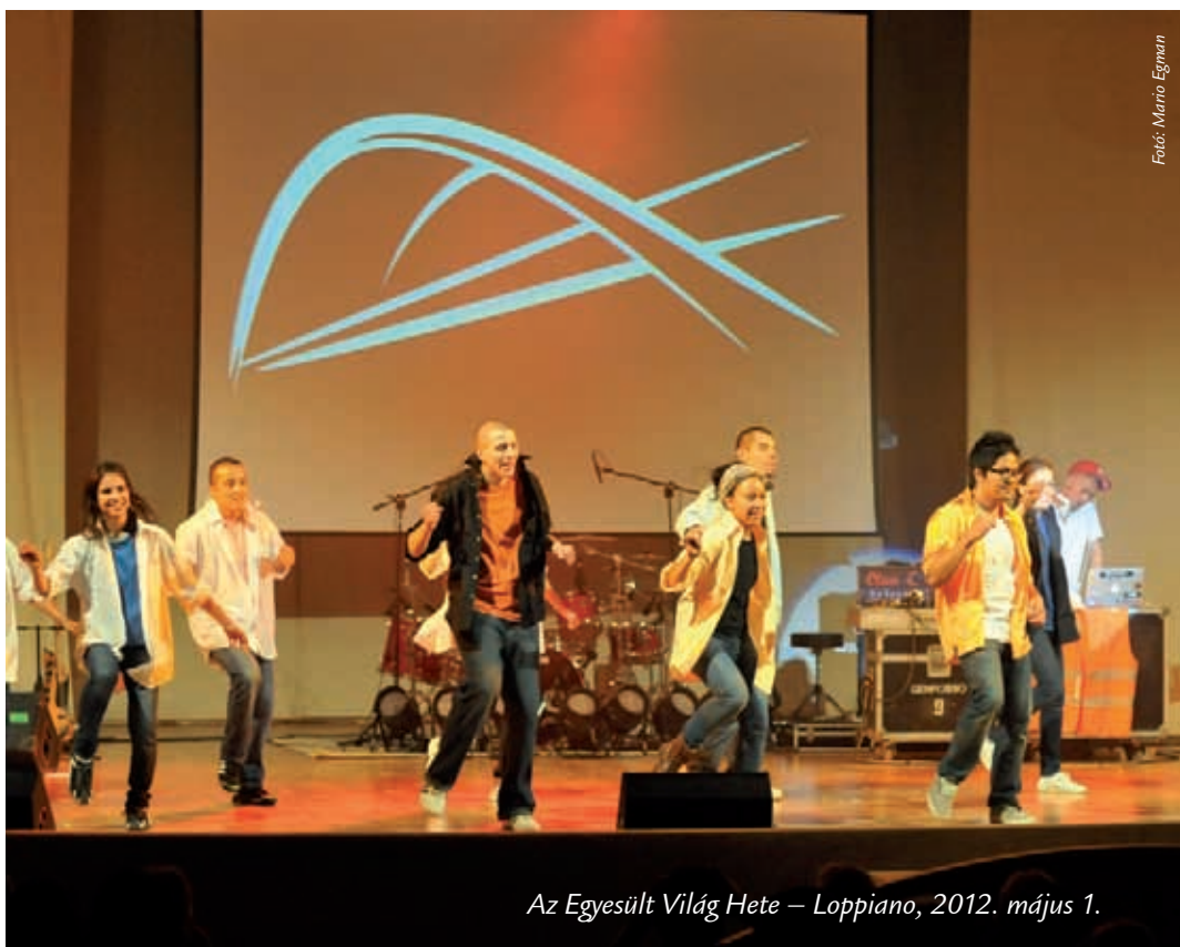
Az Egyesült Világ Hete – Loppiano, 2012. május 1.

Nem álmokat kergetünk tehát, ha azt mondjuk, hogy az egyesült világért élünk. Szeretnénk hozzájárulni, hogy megvalósuljon Jézus végrendelete a társadalomban: „Legyenek mindnyájan egy” (Jn 17,21). Ennek az egységnek a megvalósítása azokban a kisebb közösségekben kezdődik, amelyek mindennapjainkban körülvesznek bennünket. De nem akarunk itt megállni: szeretnénk, ha a fiatalok között egyre inkább elterjedne ez az újdonság, mely megoldást hozhat korunk problémáira. Hiszen a Genfest tétje pontosan az, hogy felmutassuk a világnak azt az egységet, mely közöttünk már valószínűleg létezik. Se több, se kevesebb. ■