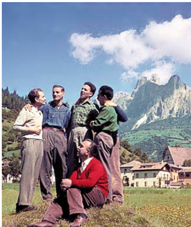
Lent: Az első fokolarinik egy csoportja a Dolomitokban.

elő párbeszédet. Ez volt az ő művészete és ezzel adott választ Vale tanácsára, aki azt mondta neki azon a bizonyos estén: Kiváló művészek mindig is voltak és lesznek is, de ma szentekre van szükség.”