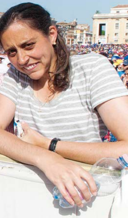
Fotó: Domenico Salmasso (2)

Lent: Maria Voce 2012 szeptember 1-jén a budapesti Genfesten. Az Általános Statútumok szerint a Fokoláre Mozgalom elnöke mindig nő lesz.