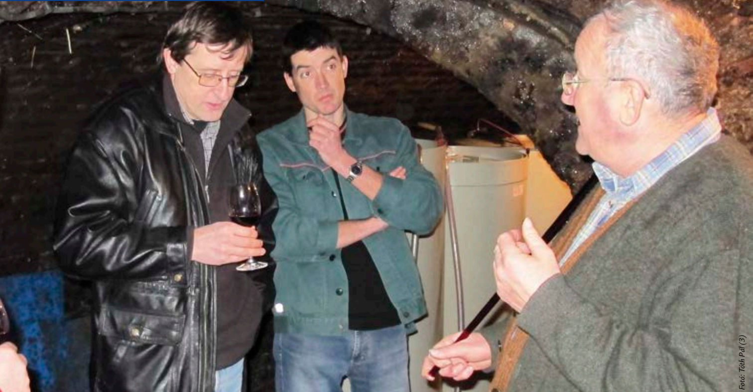
Fotó: Tóth Pál (3)