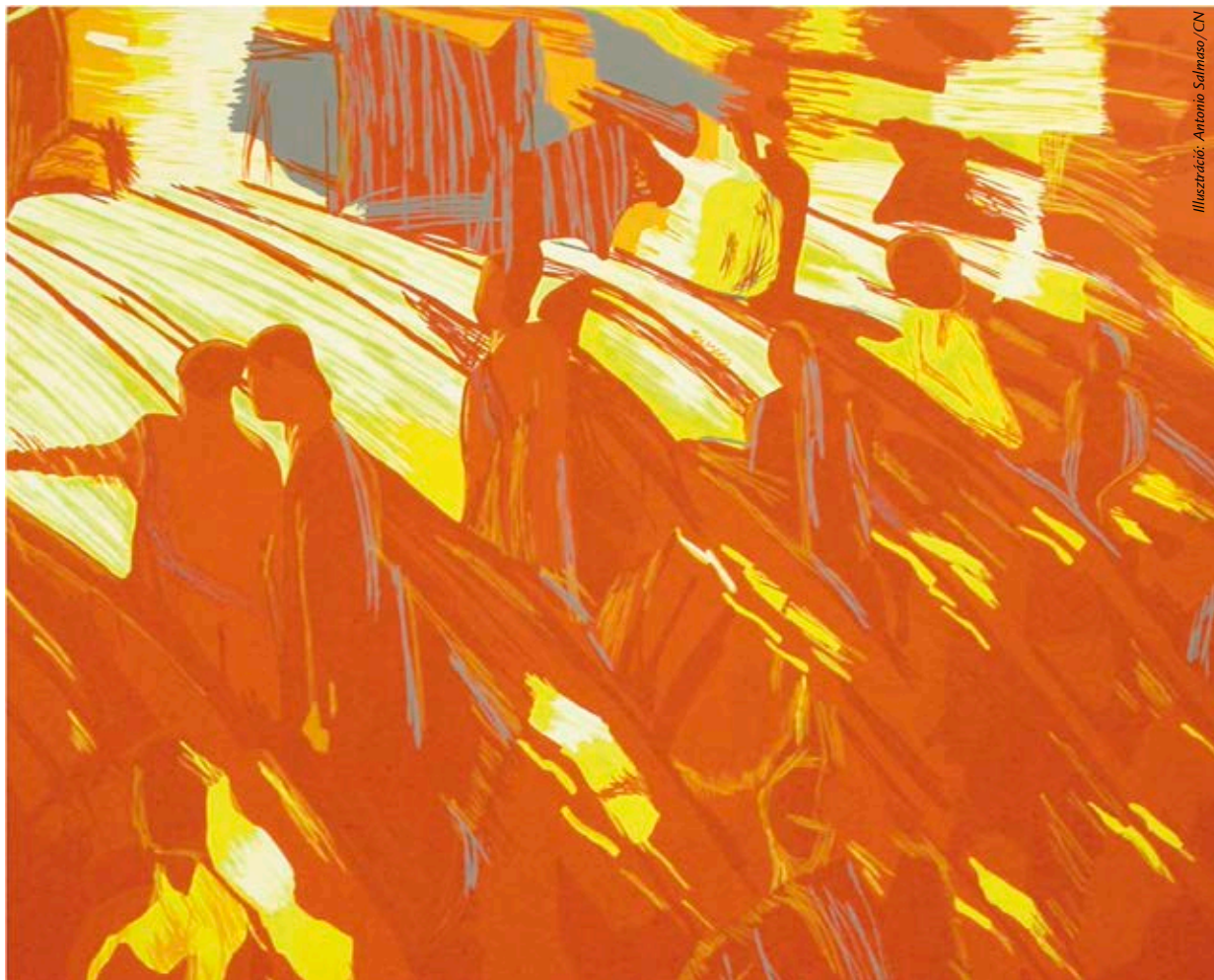
Illusztráció: Antonio Salmasso/CN