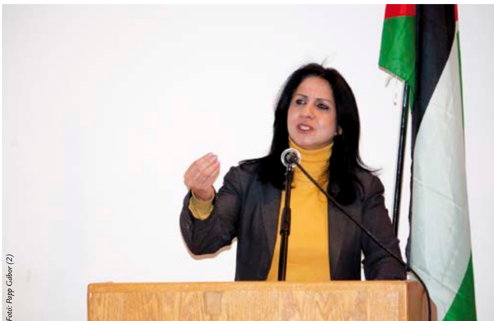
Fotó: Papp Csábor (2)

Be the bridge! (Legyél Te a híd!) Művészeti és kulturális események, műhelymunkák és egy nemzetközi szimpózium várták az odaérkező fiatalokat. Magyarországról is indult egy delegáció, hogy részt vegyen az eseményen. Szabina rögtön kiemeli a helyszín szimbolikus értékét. „A zsidó, a muzulmán és a keresztény világ találkozása. A találkozó színhelyéül azért választották Jeruzsálemet, mert ez a település az ellentétek városa, különböző népek és vallások jelenlétét hor-