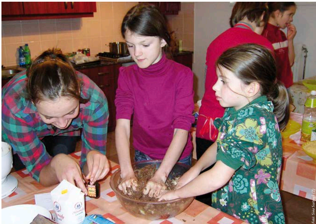
Fotó: Silvia Szatmari (2)

– Amikor anyának segítesz, akkor is ilyen lelkesedéssel teszed? – Mira egyértelmű igennel válaszol. „Ha kifogyóban van valami, akkor nem vagy csak keveset teszünk bele, például a múltkor nem volt elég zsír és mégis éppen olyan finom lett a pogácsa. Szívesen belemegyek ebbe a történetbe. Otthon is volt olyan, hogy elfogyott valami és akkor anyával egy kicsit másképp csináltuk, de ugyanolyan ízletes lett.”