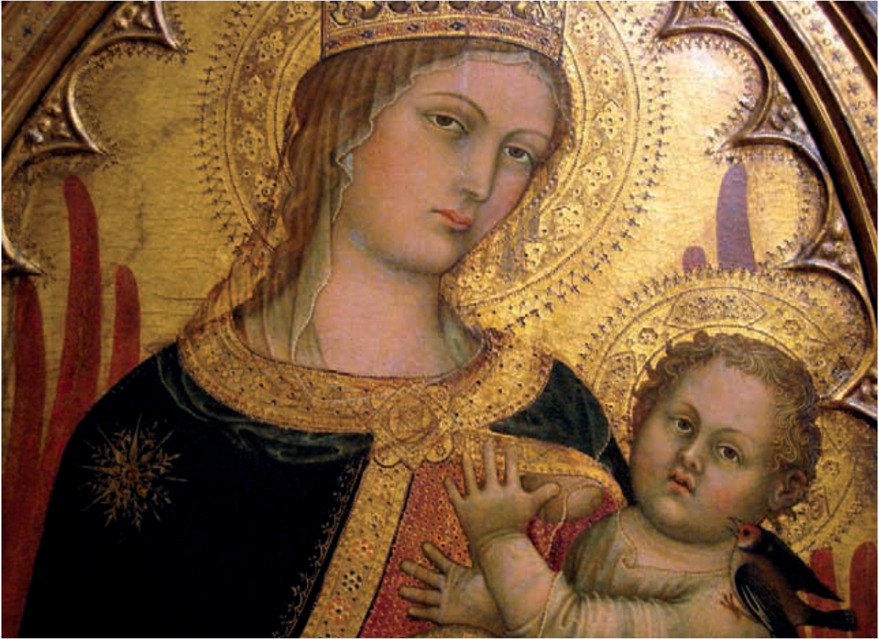
Di Bartolo: Madonna gyermekkel.

házasársi szeretetet, mint Krisztus teljesen önmagát az egyháznak átadó szeretetének jelét; az apaságot és anyaságot, mint a Teremtő termékeny szeretetében való közreműködést; a békét és harmóniát az összes feszültség és nehézség legyőzésében, mint egy mindig élő szeretet gyümölcset, amelyik fáradhatatlanul azon munkálkodik, hogy Krisztus lelkileg jelen legyen a családban és Vele a család egységben gondolkodjon és cselekedjen; hogy élje a közösség kinyílását és szolgálatát más családok felé.