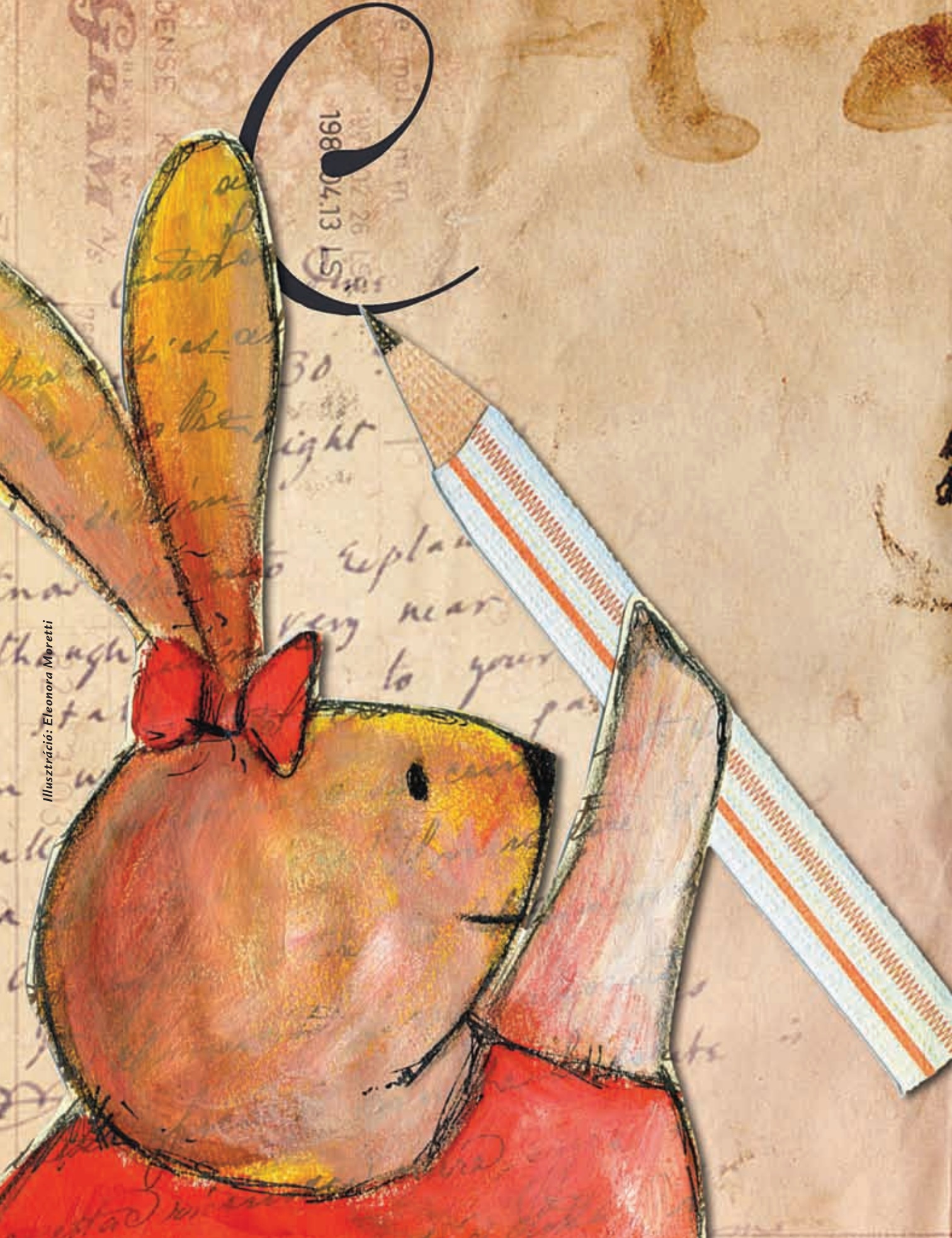
Ilustración: Eleonora Moretti