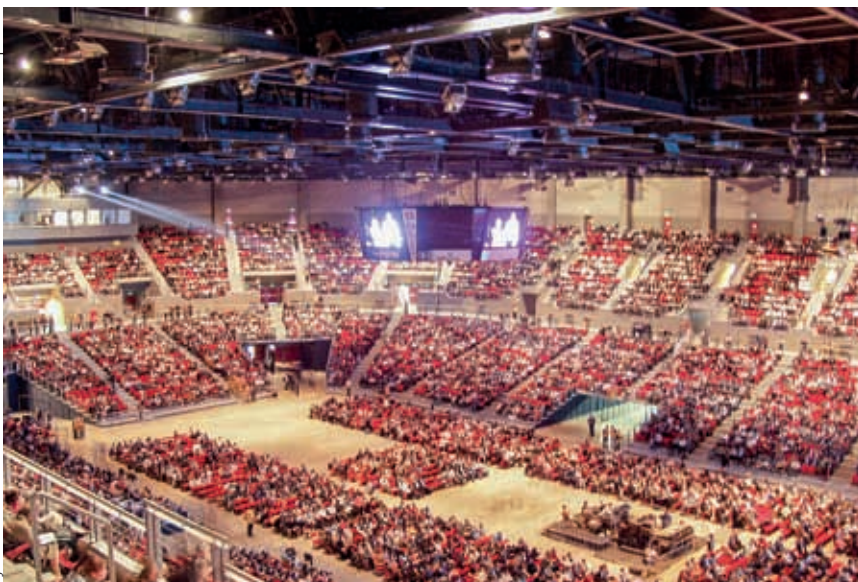
Új Város archívumból

T. Z: Sőt, szükséges is (lenne)! Ez a bizonyágtétel és a közeledés elsőrendű lehetőségét adná. Közösen meghatározott témákban, közösen végiggondolt formában gondolkodni, megnyilvánulni kívül és belül is erőt adna. Ehhez meg kell erősíteni azokat a műhelyeket egyházon belül, akik képesek kellő nyitottsággal és ismerettel háttérrel adni egy-egy ilyen törekvéshez. A gondolkodás tárgyának