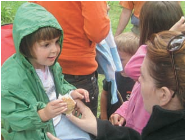
Fotó: CN (2)

Nekem ez öröm volt, mert mindig is a pozitív motivációban hittem, a többi félelmet és bizonytalanságot szül. Az a tapasztalatom, hogy a kritikus megjegyzések nyomán végzett szakmai fogások nem épülnek be a mindennapi munkába. ■