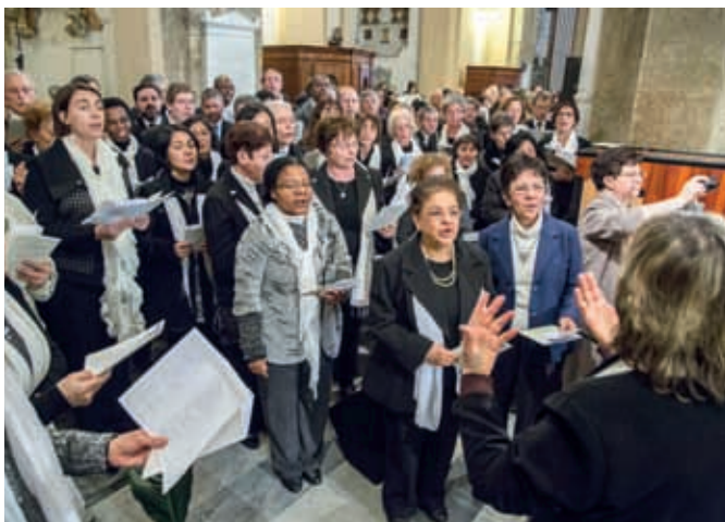
© CSC, Andriovskij – C. Mendes

és bizonyították, hogy lehetséges és szép dolog együtt és egységben bejárni az egyetlen cél felé vezető utat”. „Alázattal várjuk a Szentatya bölcs megítélését – hangzott el végül –, és kérjük Istent, hogy dicsőségére és sokak javára, Chiara hősies erőneinek esetleges elismerésével az emberiség a béke, az egység és az egyetemes testvériség fejlődésének új formáit ismerhesse meg. Igen, mert tekintetét és szívét egy egyetemes szeretet mozgatta, ami képes volt átölelni minden embert a különbözőségeken túl, mindig arra figyelve, hogy megvalósítsa Jézus végrendeletét, hogy »legyenek mindnyájan« egy.”