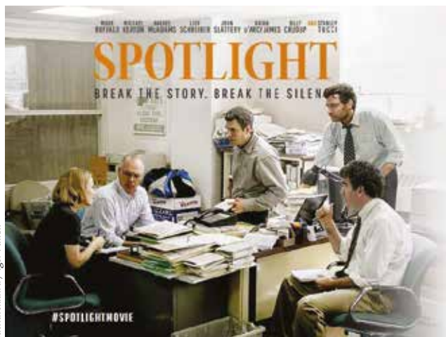
patriciaharrill.ru / Igor Pallin

A sajtó kiemelt feladata a tényfeltárás.