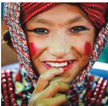
Fotó: CN (7)

sztyeppéiről az indiai alföldekre és vissza igyekvő karavánok, zarándokok és kalandorok haladnak át.